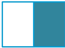
1/1 sivu 222 x 276