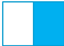
1/1 sivu 134 x 184