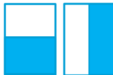
1/2 vaakaa 1/2 pysty 134 x 92 63 x 184